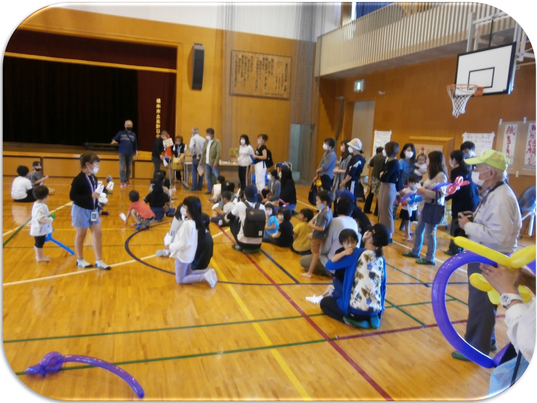
令和4年度 高野口町青少年健全育成会総会 令和4年6月10日