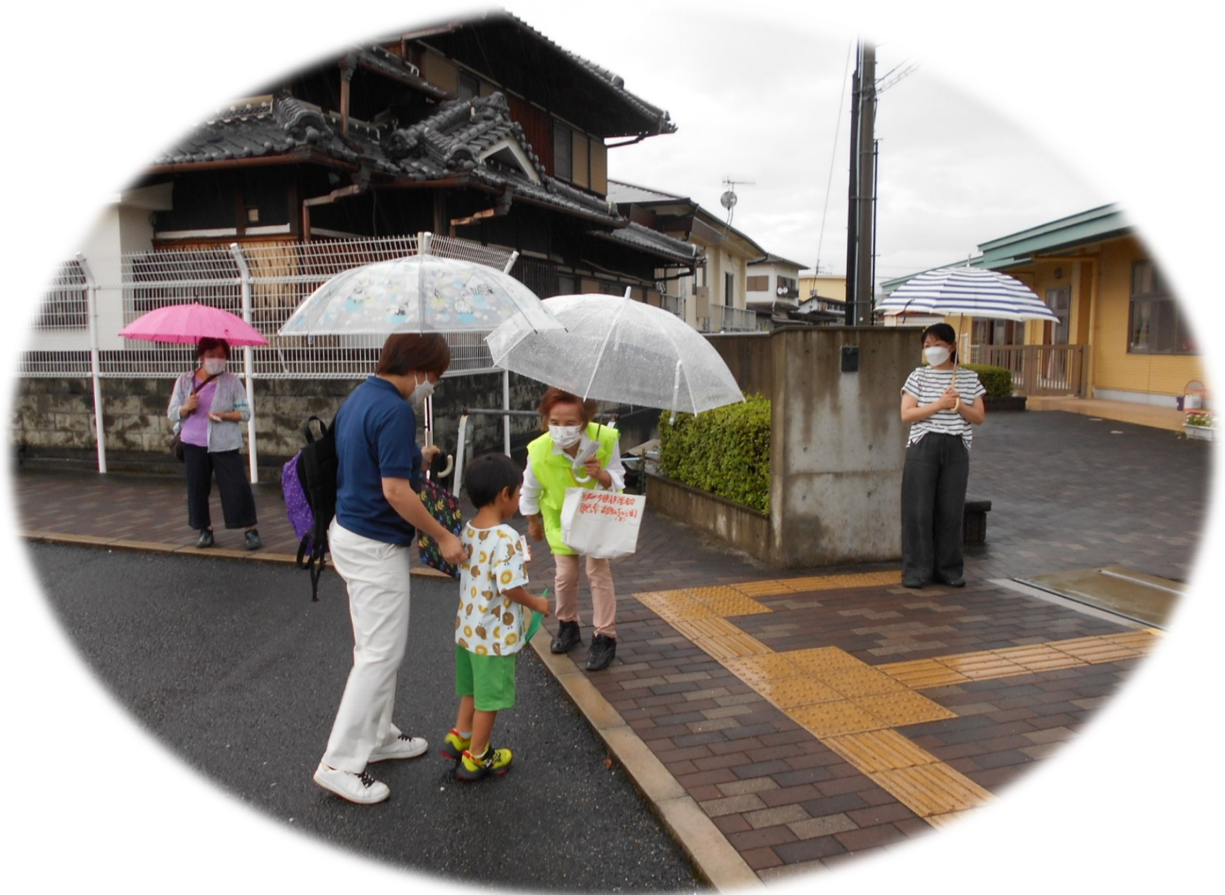
下 高野口こども園