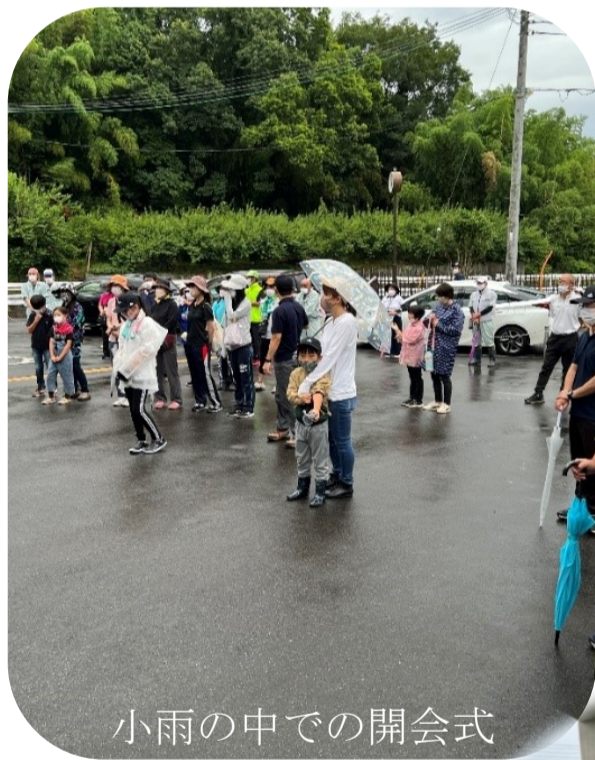
小雨の中での開会式